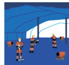
Рис. 2. Выполнение работ под тепляком