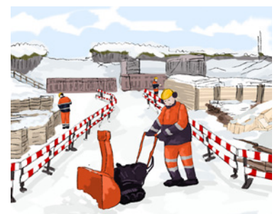
Рис. 3. Уборка снега с путей сообщения