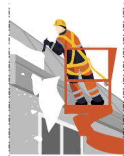
Рис. 4. Уборка снега с элемента здания работником в корзиночном подъемнике